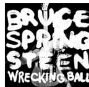
La portada del disc

Wrecking ball , amb títols com Easy money , This depression , i Land of hope and dreams (que ja